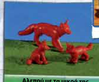
Αλεπού με τα μικρά της