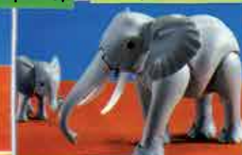
Ελέφαντας και ελεφαντάκι