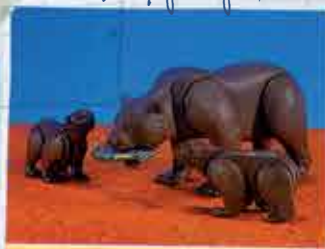
Καφέ αρκούδα και αρκούδκια