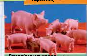
Γουρούνα και γουρουνάκια

Τα καρβινοφάρα: Τα κηαιμωρό και τα κηαιράγα. Έχουν έναν θάκο στην κηαιοκηηή της κηαιγιάς, όπου κηαιτάνε τα κηαιμιά τους κηαιρά τη γένημα. Τα καρβινοφάρα ζουν στην Αυστραλία.