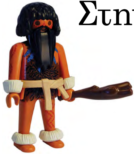
Από το απλό ρόπαλο στα όπλα και στα εργαλεία από σίδηρο, ο άνθρωπος βελτιώνει την ικανότητά του να κυνηγάει και να μάχεται.

Ε χοντας εμφανιστεί στη Γη πριν από τέσσερα εκατομμύρια χρόνια, ο άνθρωπος βιάζεται να εξελιχθεί και να προοδεύσει. Φεύγει από το σπίτι του στην Αφρική και εγκαθίσταται προοδευτικά στην Ασία και στην Ευρώπη και αργότερα στην Αμερική. Στην αρχή όλοι οι άνθρωποι είναι νομάδες. Μετακινούνται από τη μια περιοχή στην άλλη βάσει των καρπών που