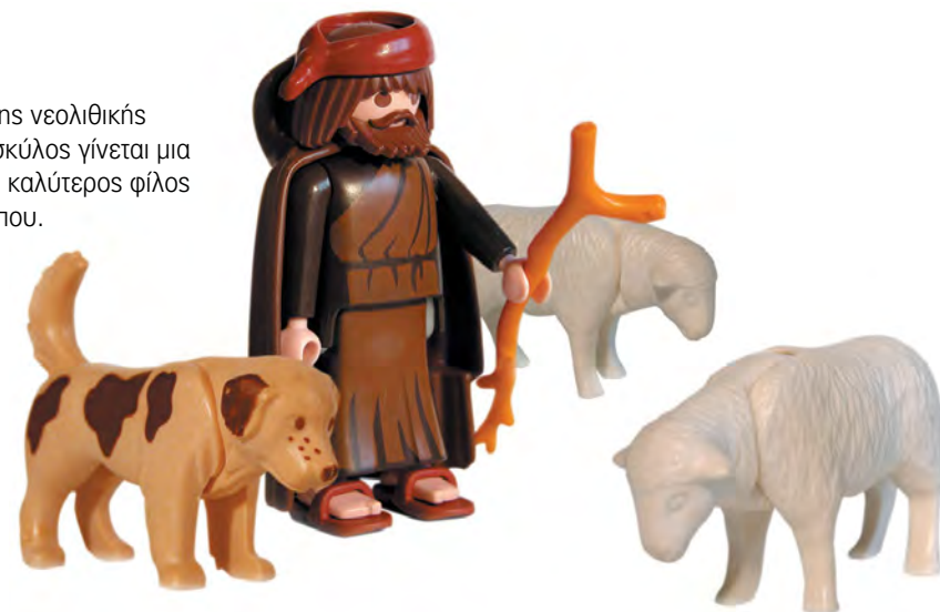
Στο τέλος της νεολιθικής εποχής, ο σκύλος γίνεται μια για πάντα ο καλύτερος φίλος του ανθρώπου.

και η κτηνοτροφία. Από τότε και στο εξής οι άνθρωποι εγκαθίστανται σε πραγματικά χωριά, που έχουν ολόγυρα χωράφια με σάρι. Επίσης αποκτούν κοπάδια με άλογα, πρόβατα και γουρούνια που έχουν εξημερώσει.