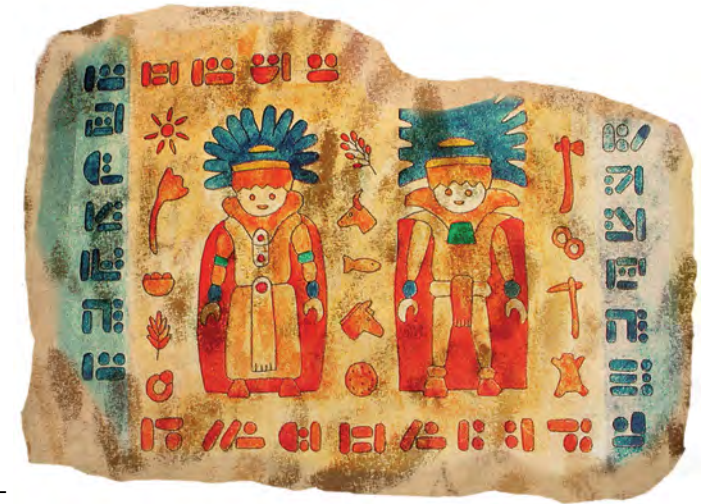
Η ζωγραφική είναι η αρχή σε όλες τις γραφές. Στη συνέχεια εξελίσσονται τα εικονογράμματα, προτού οι Φοίνικες ανακαλύψουν το αλφάβητο.

Στη μακρινή Ασία κάποιοι άνθρωποι ψάχνουν επίσης τα μονοπάτια της σοφίας. Στην Κίνα, γύρω στο 500 π.Χ., ο Κουμφούκιος διδάσκει την αρετή, ενώ στην Ινδία ένας πρίγκιπας με το όνομα Σιντάρτα εγκαταλείπει την πολυτελή ζωή του για να διαλογιστεί γυμνός, με δύο φίδια φύλακες να τον προστατεύουν από τη βροχή. Εμείς τον γνωρίζουμε με το όνομα Βούδας.