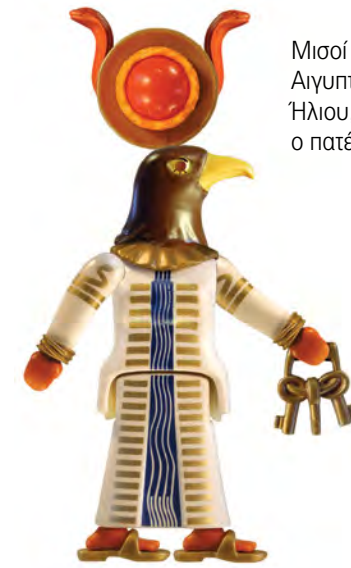
Μισοί άνθρωποι, μισοί ζώα, οι θεοί των Αιγυπτίων είναι χιλιάδες. Ο Θεός του Ήλιου, ο Ρα, είναι επίσης και ο πατέρας του φαραώ που κυβερνάει.