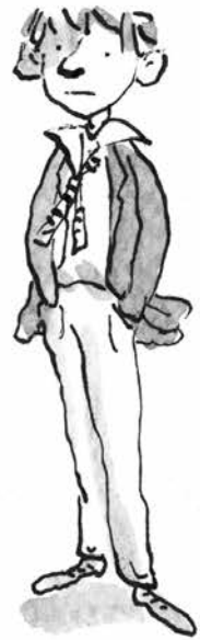
Άλφι, το αγόρι με τα χαλασμένα δόντια