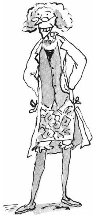
Κυρία λαχίνα, καθηγήτρια φυσικής