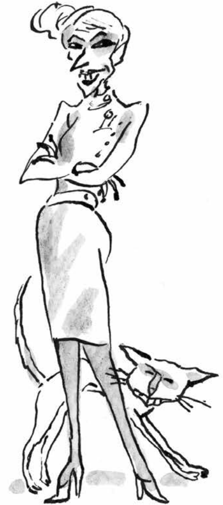
Κυνόδοντας, ο γάτος της