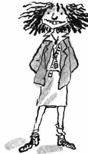
Γκαμπζ, ένα μικροσκοπικό κορίτσι