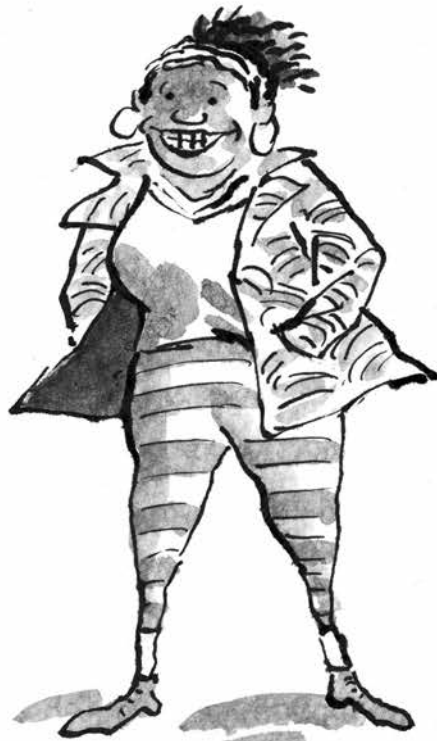
Γουίι, κοινωνική λειτουργός