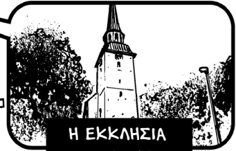
Η ΕΚΚΛΗΣΙΑ ΤΗΣ ΜΑΡΙΕΦΡΕΤ