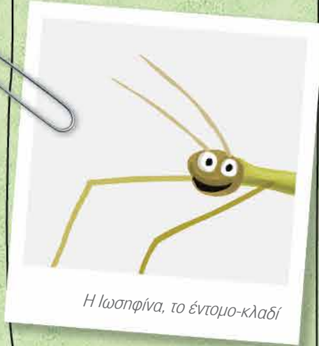
Η Ιωσφίνα, το έντομο-κλαδί