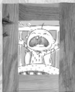
κι ο Αντωνάκης...