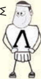
ΛΑΧΗΣ Ο ΑΧΩΝΕΥΤΟΣ