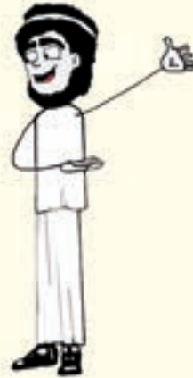
ΜΠΑΜΠΑΣ Ο ΞΕΡΟΛΑΣ