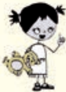
ΑΡΤΕΜΙΣΟΥΛΑ Η ΦΑΝΤΑΣΙΟΠΛΗΚΤΗ