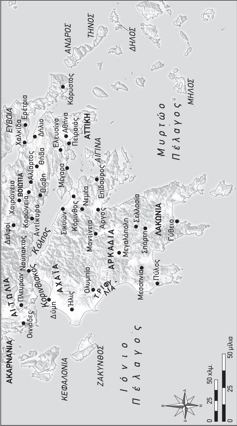
Χάρτης Ε Πελοπόννησος και Κεντρική Ελλάδα