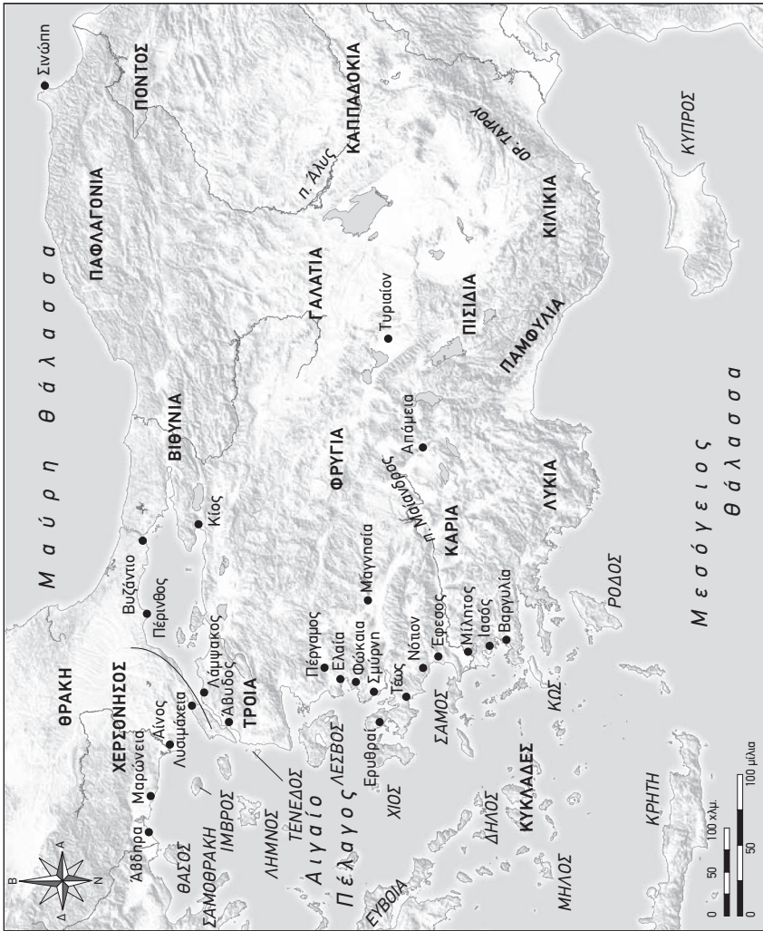
Χάρτης Β Μικρά Ασία και το Αιγαίο