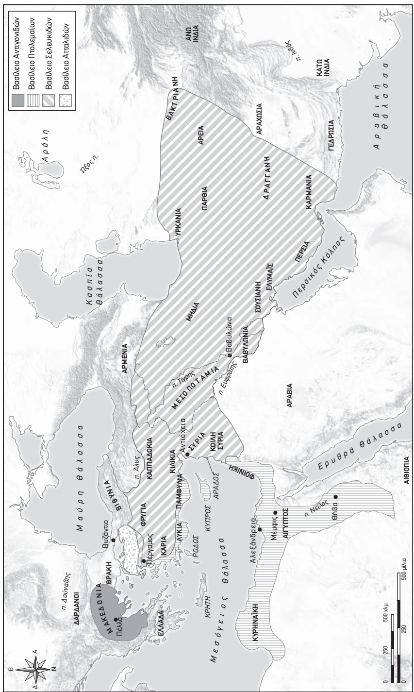
Χάρτης Α Τα ελληνιστικά βασίλεια γύρω στο 230 π.Χ.