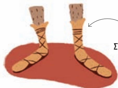
ΑΡΧΑΙΟ ΣΤΙΛΙΣΤΙΚΟ ΛΑΘΟΣ!

Όπως και τα ρούχα στην αρχαία Ελλάδα, έτσι και τα παπούτσια ήταν πολύ απλά. Δεν είχαν να διαλέξουν ανάμεσα σε ΑΘΛΗΤΙΚΑ, ΤΑΚΟΥΝΙΑ και ΓΑΛΟΤΣΕΣ . Είχαν, πάντως, μπότες και σανδάλια και μάλιστα φορούσαν κάλτσες για να κρατούν τα δάκτυλά τους σε κουκουλιάρικη κατάσταση. Σανδάλια με κάλτσες κανείς;