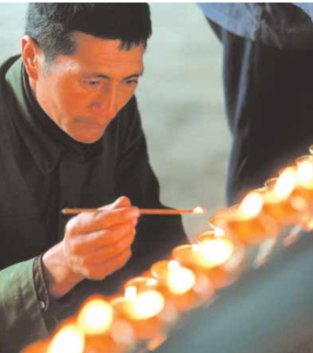
Προσκυνητές ανάβουν κεριά φτιαγμένα με βούτυρο από γιак στο σημαντικότερο βουδιστικό κέντρο του Θιβέτ, το Ναό Τζόχανγκ στη Λάσα.

ζονται οι πρώτες μαρτυρίες ότι λέξεις που κάποτε αναφέρονταν στη συμπεριφορά, τη δημόσια εικόνα και την κοινωνική θέση (όπως «ευσέβεια» και «σεβασμός») άρχισαν να λαμβάνουν συναισθηματικό χαρακτήρα ως υποθέσεις προσωπικής τάξεως-, η σύγχρονη αντίληψη ότι όλοι διαθέτουμε έναν εσωτερικό πυρήνα πίστης που εκφράζεται δημόσια στην τελετουργία είναι τόσο διαδεδομένη ώστε σχεδόν κανείς δεν την αμφισβητεί. Αυτή ακριβώς η αντίληψη εμπνέει ένα σύνολο ανθρώπων που θα μπορούσαμε να τους ονομάσουμε «ουσιοκράτες»: και αυτό διότι υποστηρίζουν πως το φαινόμενο «θρησκεία» αναφέρεται στις εξωτερικές συμπεριφορές, οι οποίες εμπνέονται από ένα