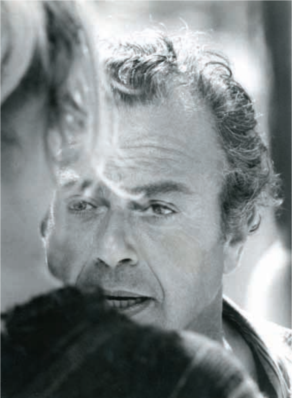
Διδάσκοντας το ρόλο της Ανδρομάχης στη Βανέσα Ρενγκρέιβ στις κινηματογραφικές Τρωάδες.