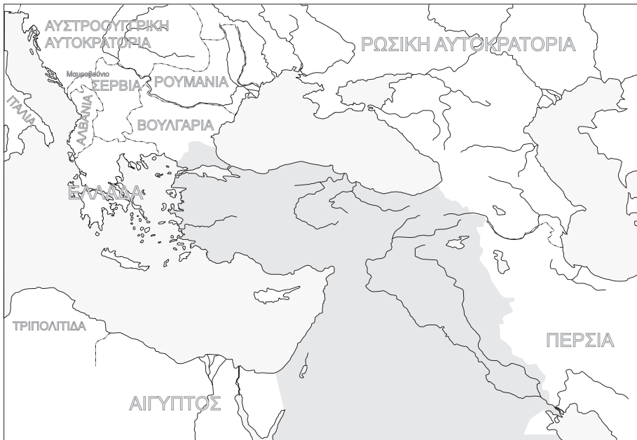
ΧΑΡΤΗΣ 2Β Η Οθωμανική Αυτοκρατορία το 1914