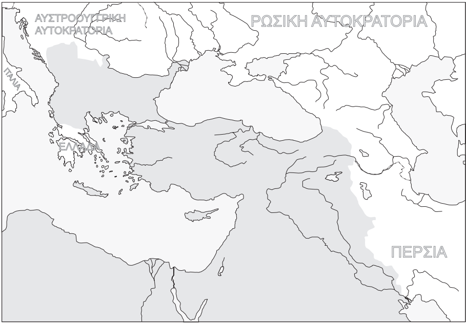
ΧΑΡΤΗΣ 2Α Η Οθωμανική Αυτοκρατορία το 1875