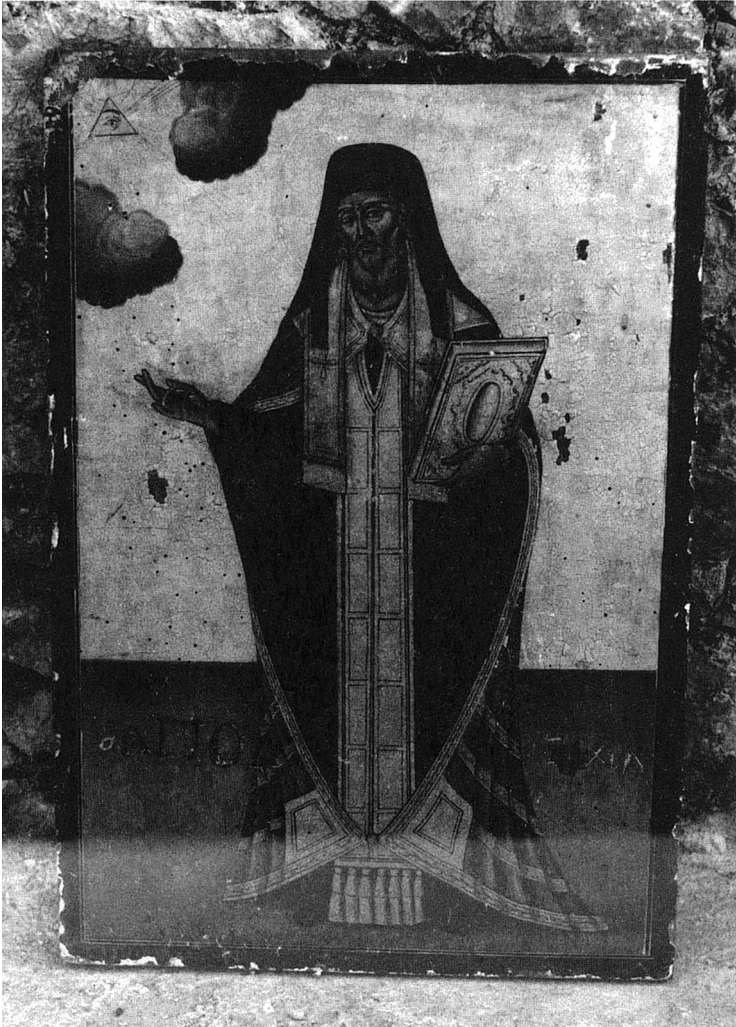
Ολόσωμη εικόνα (με αρχιερατικό μανδύα) του αγ. Μακαρίου. Βρίσκεται σε ομώνυμο παρεκκλήσι του στο χωριό Ελάτα Χίου. Κατά την παράδοση, η εικόνα έγινε το 1613 και μάλιστα από τον μοναχό Κωνστάντιο, ανιψιό του αγίου.