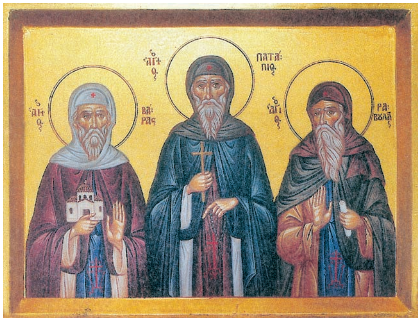
Ο όσιος Πατάπιος με τους δύο συνασκητές του Βάρα και Ραβουλά.