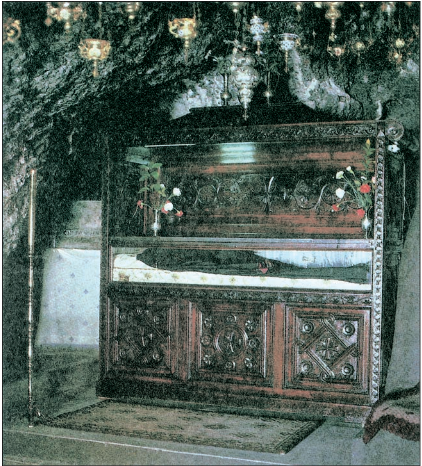
Η λάρνακα, όπου φυλάσσεται το άφθορο και θαυματουργικό σκήνωμα του οσίου Παταπίου.