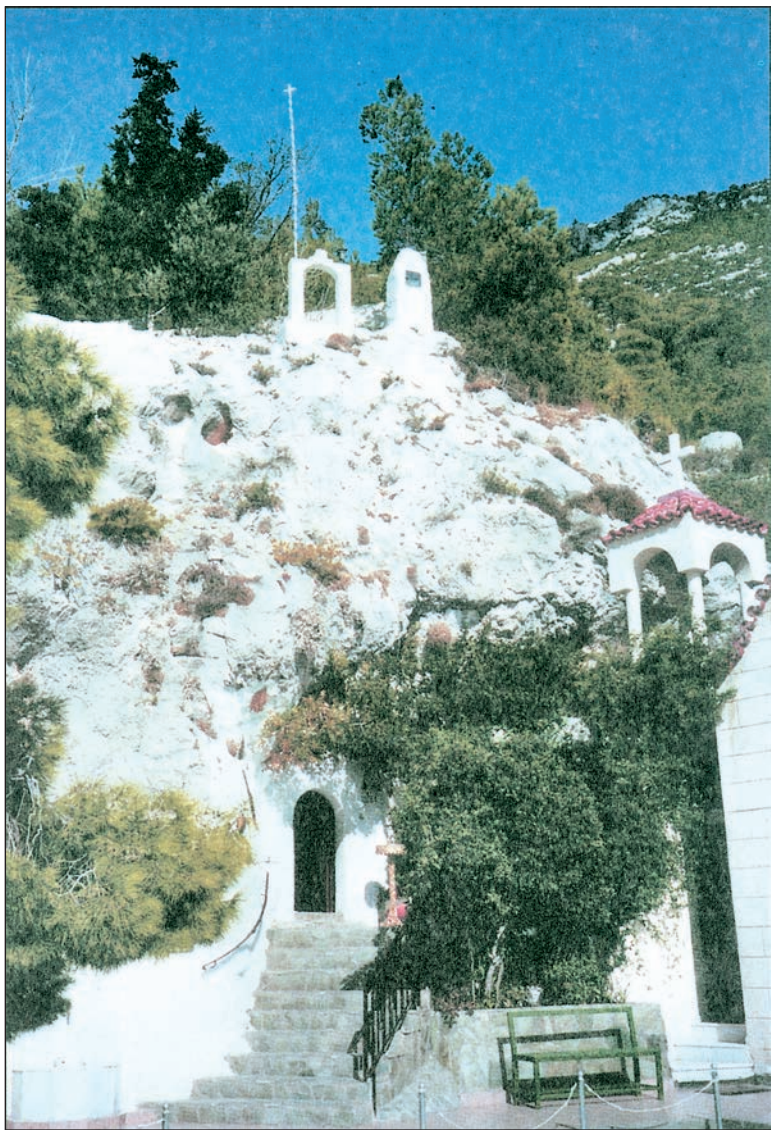
Ο βράχος και το σπήλαιο, εντός του οποίου κείται το ιερό λείψανο του οσίου Παταπίου.